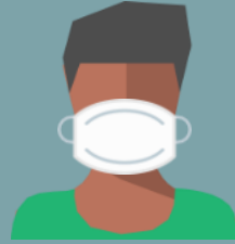
Persona con COVID-19